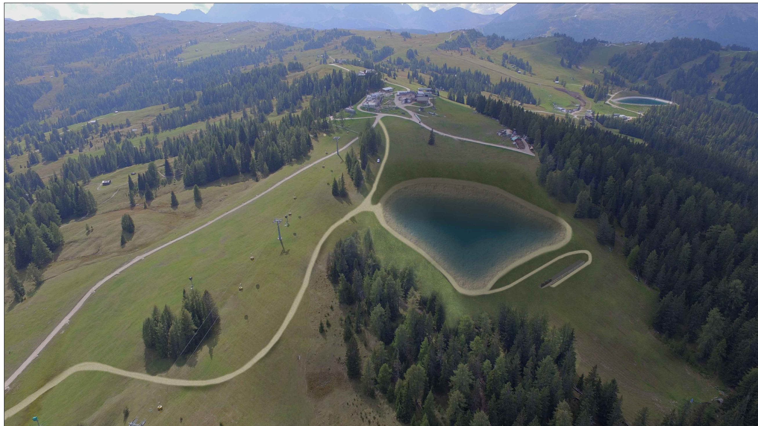
SÜD-WEST ANSICHT - PROSPETTO SUD-OVEST