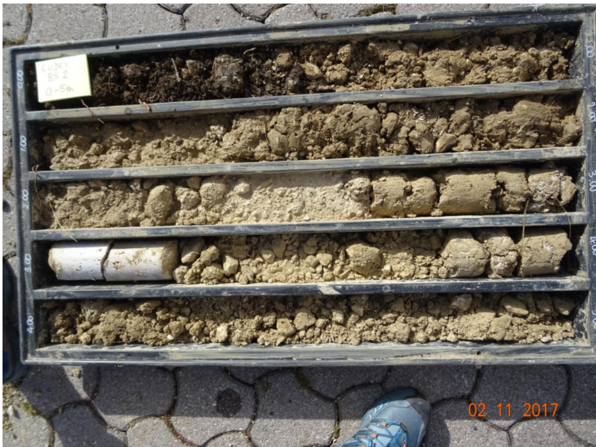
BS2 0-5 m