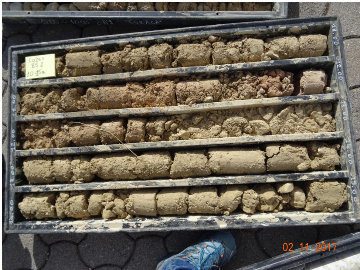
BS2 10-15 m