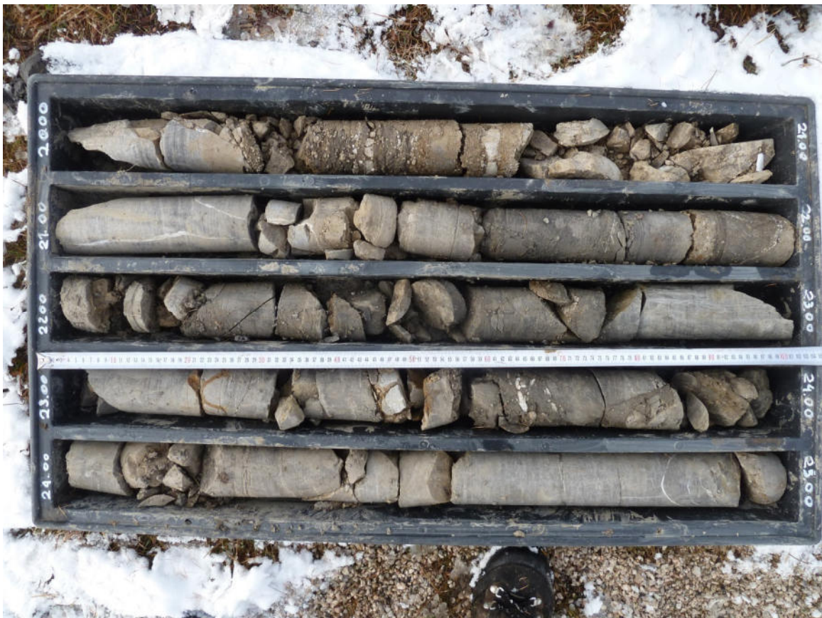
BS3 20-25 m