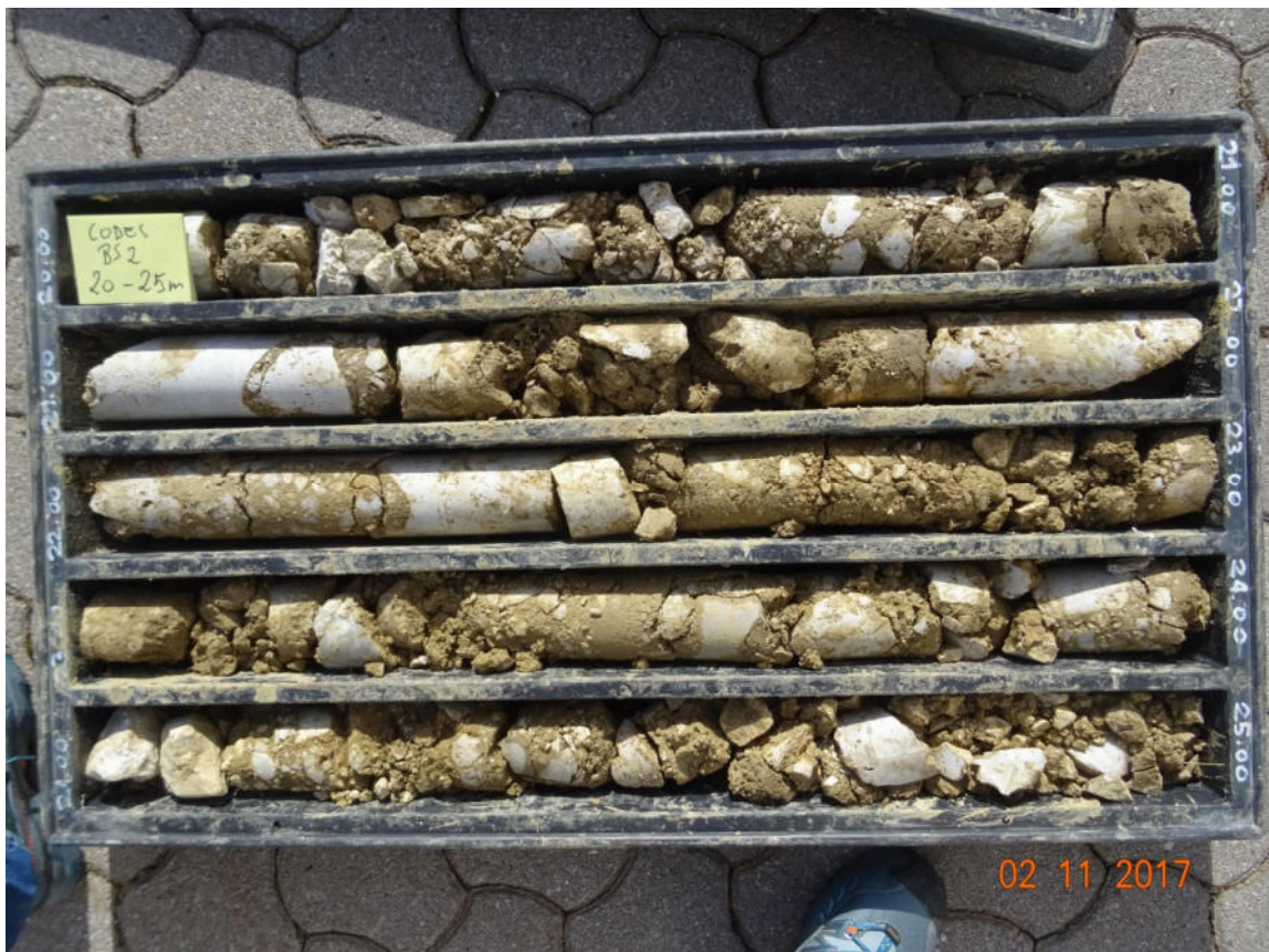
BS2 20-25 m