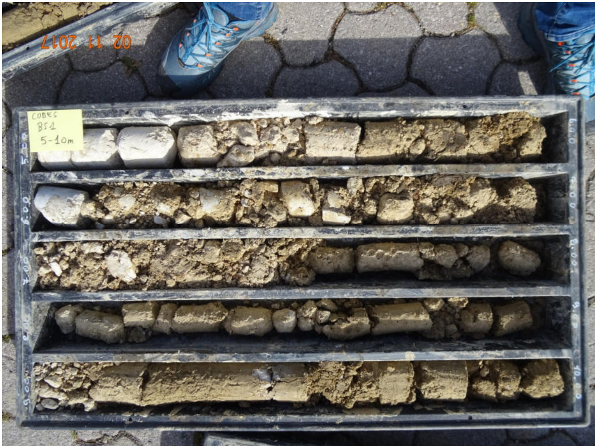
BS1 5-10 m