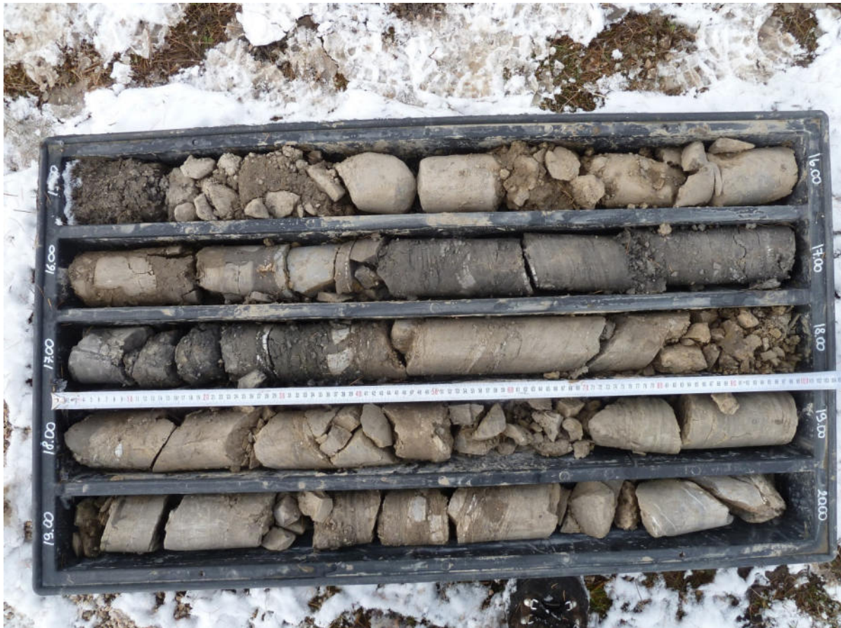
BS3 15-20 m