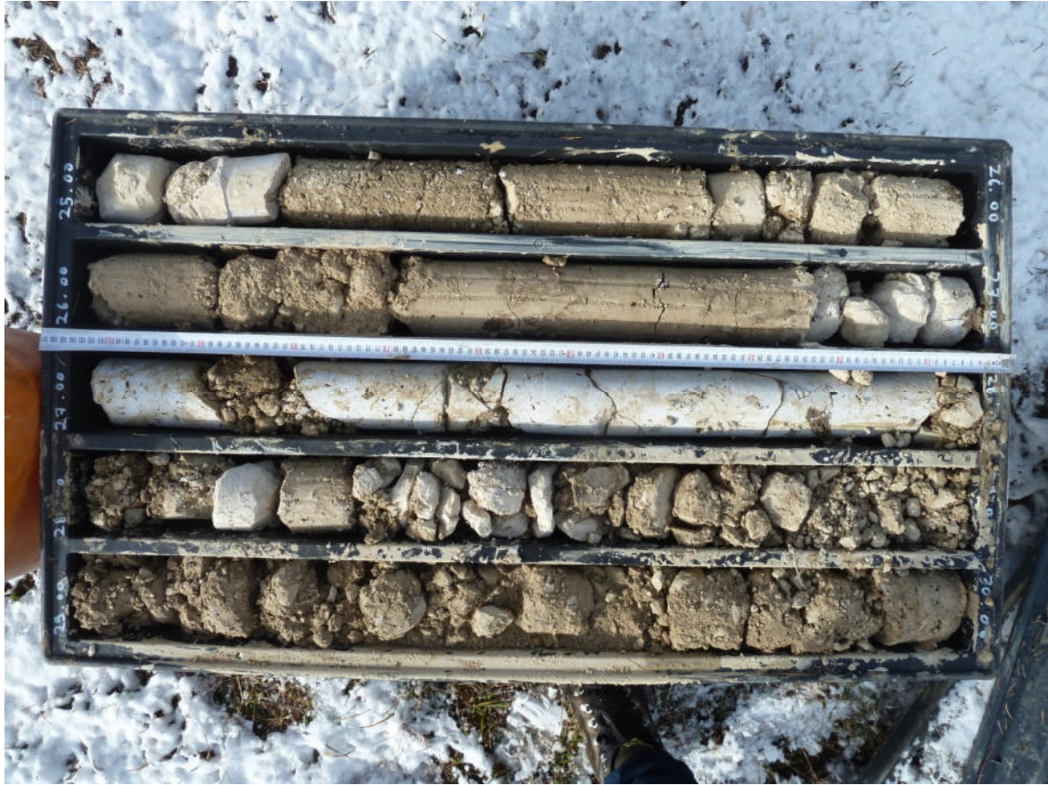
Sondaggio BS4 25-30 m