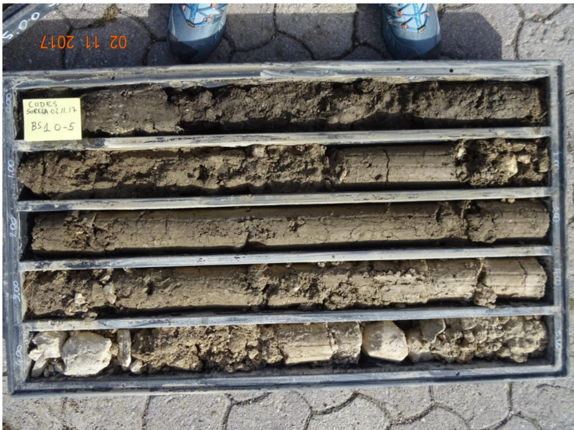
BS1 0-5 m