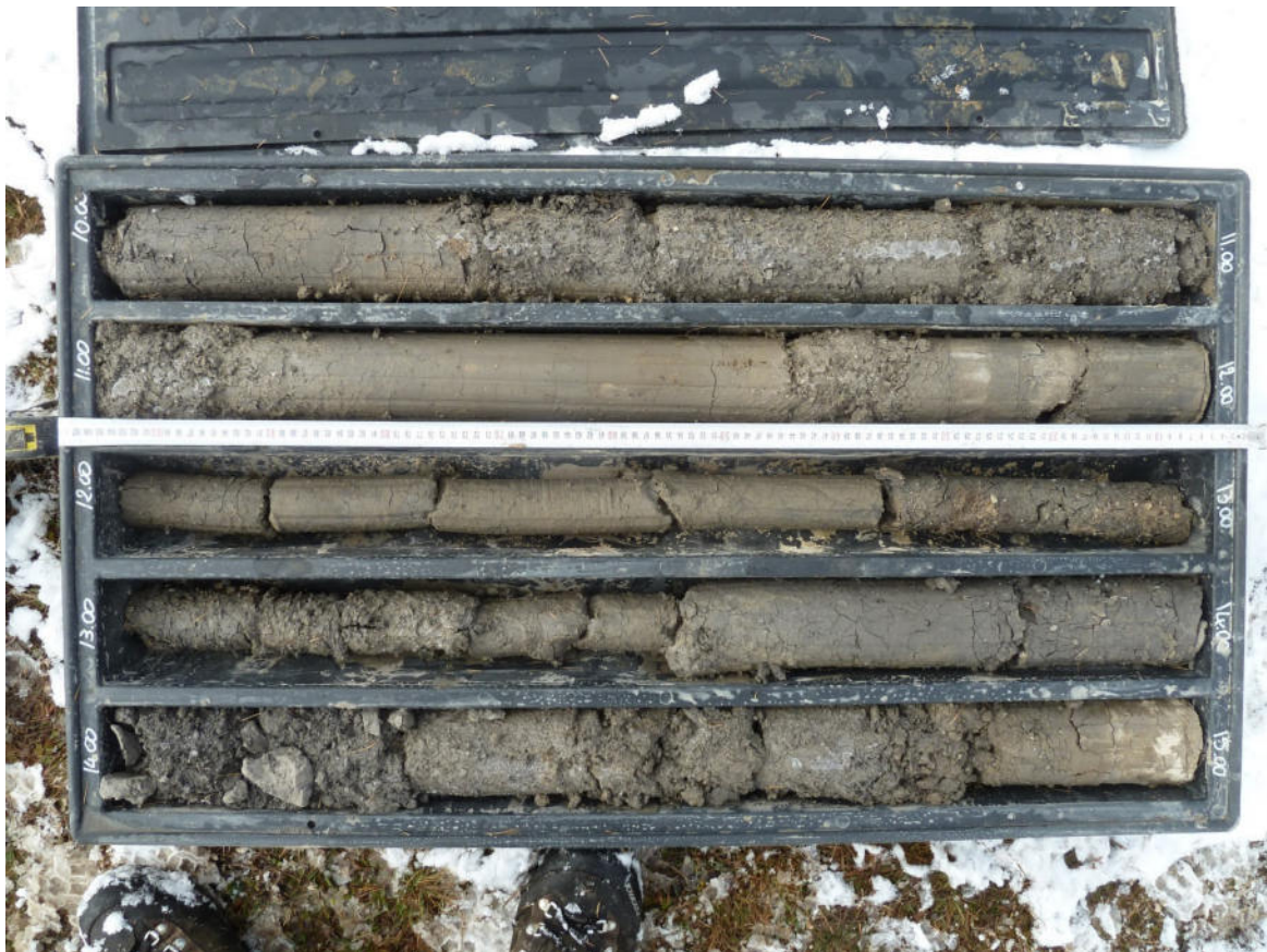
BS3 10-15 m