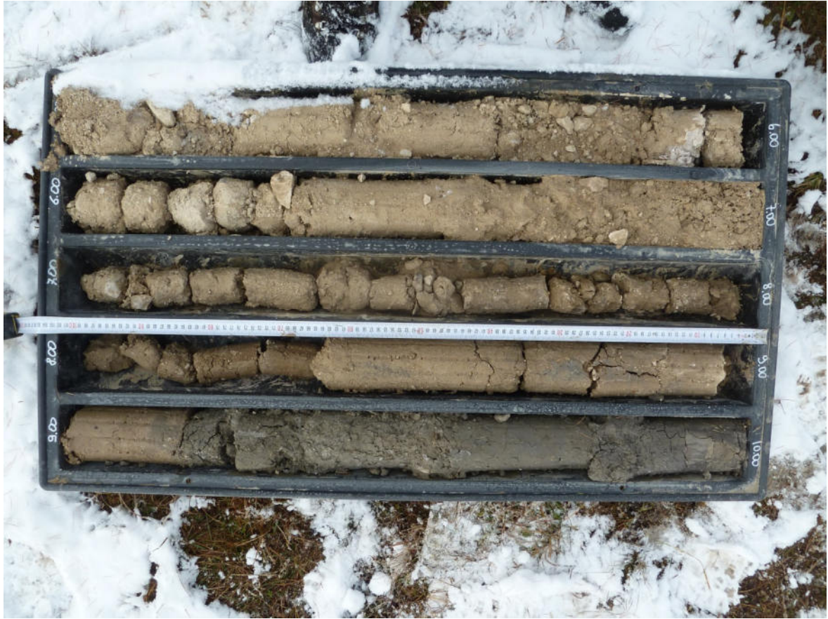
BS3 5-10 m