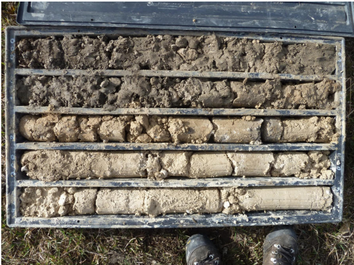
Sondaggio BS4 0-5 m