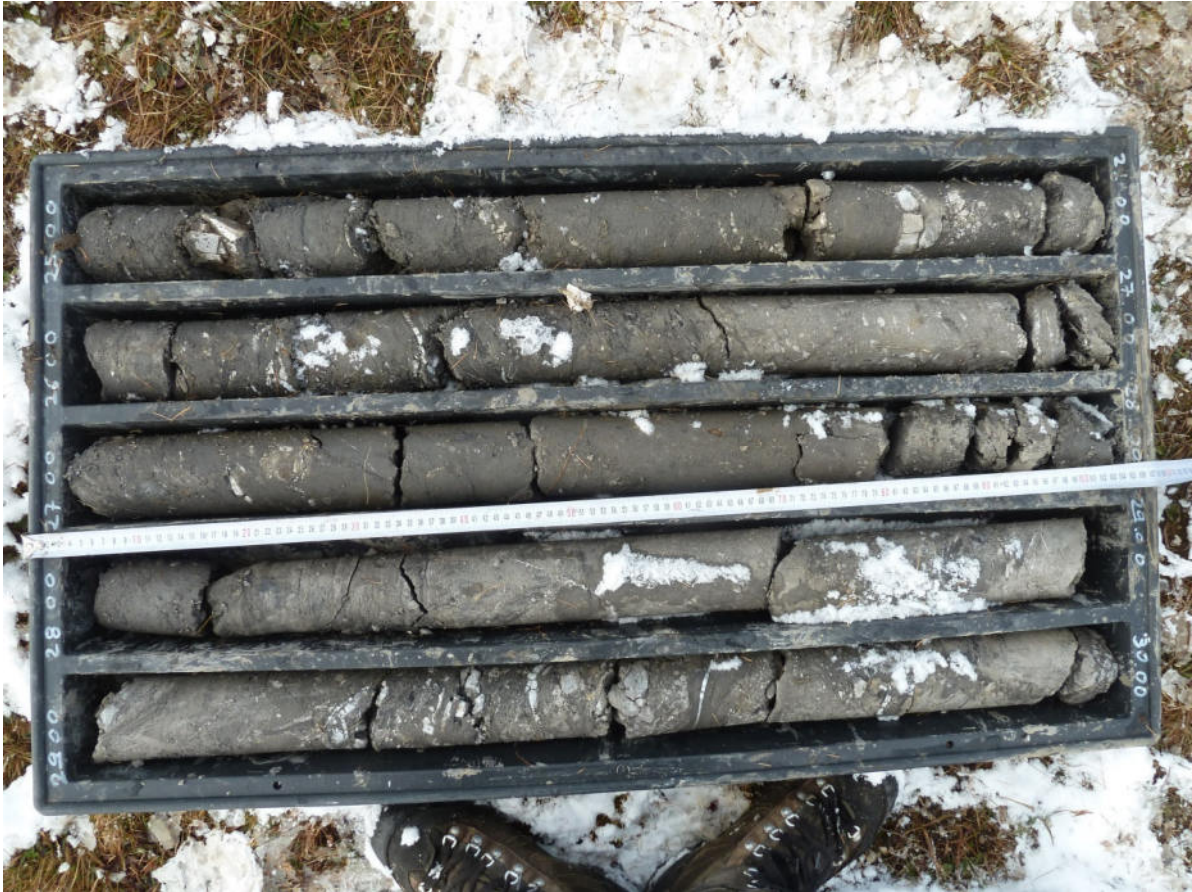
BS3 25-30 m