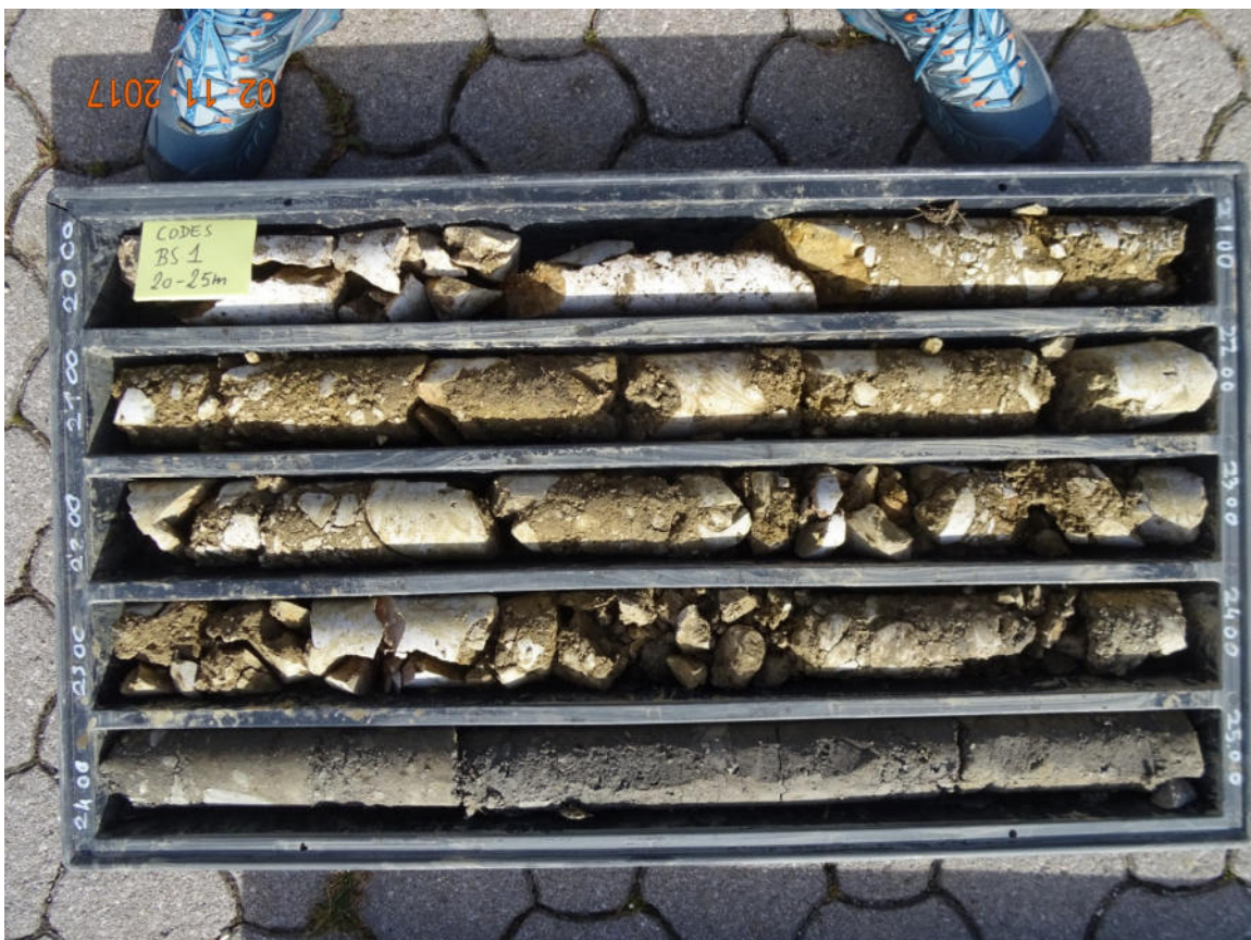
BS1 20-25 m