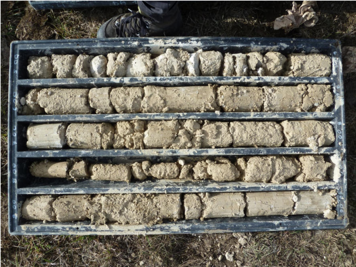
Sondaggio BS4 5-10 m