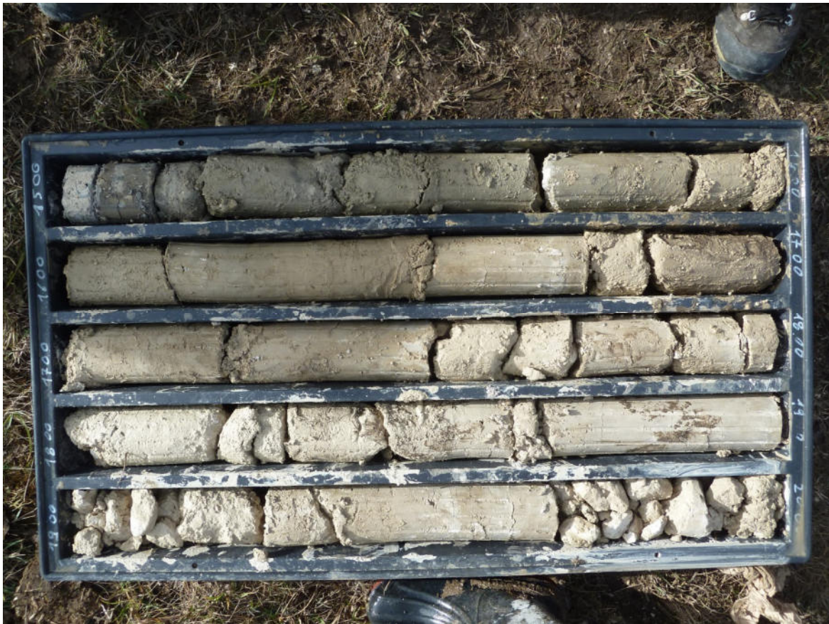
Sondaggio BS4 15-20 m