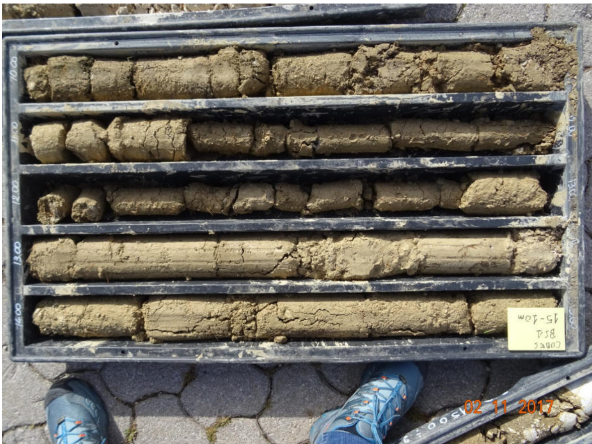
BS1 10-15 m