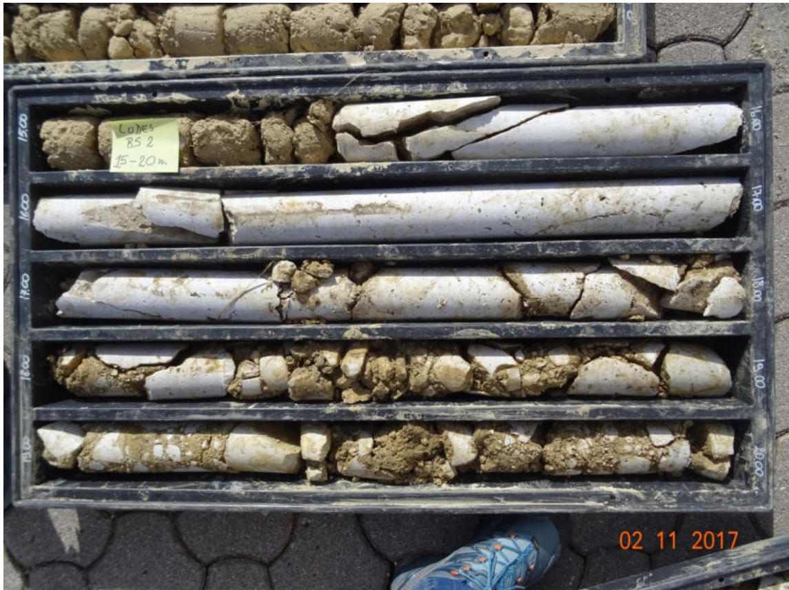
BS2 15-20 m