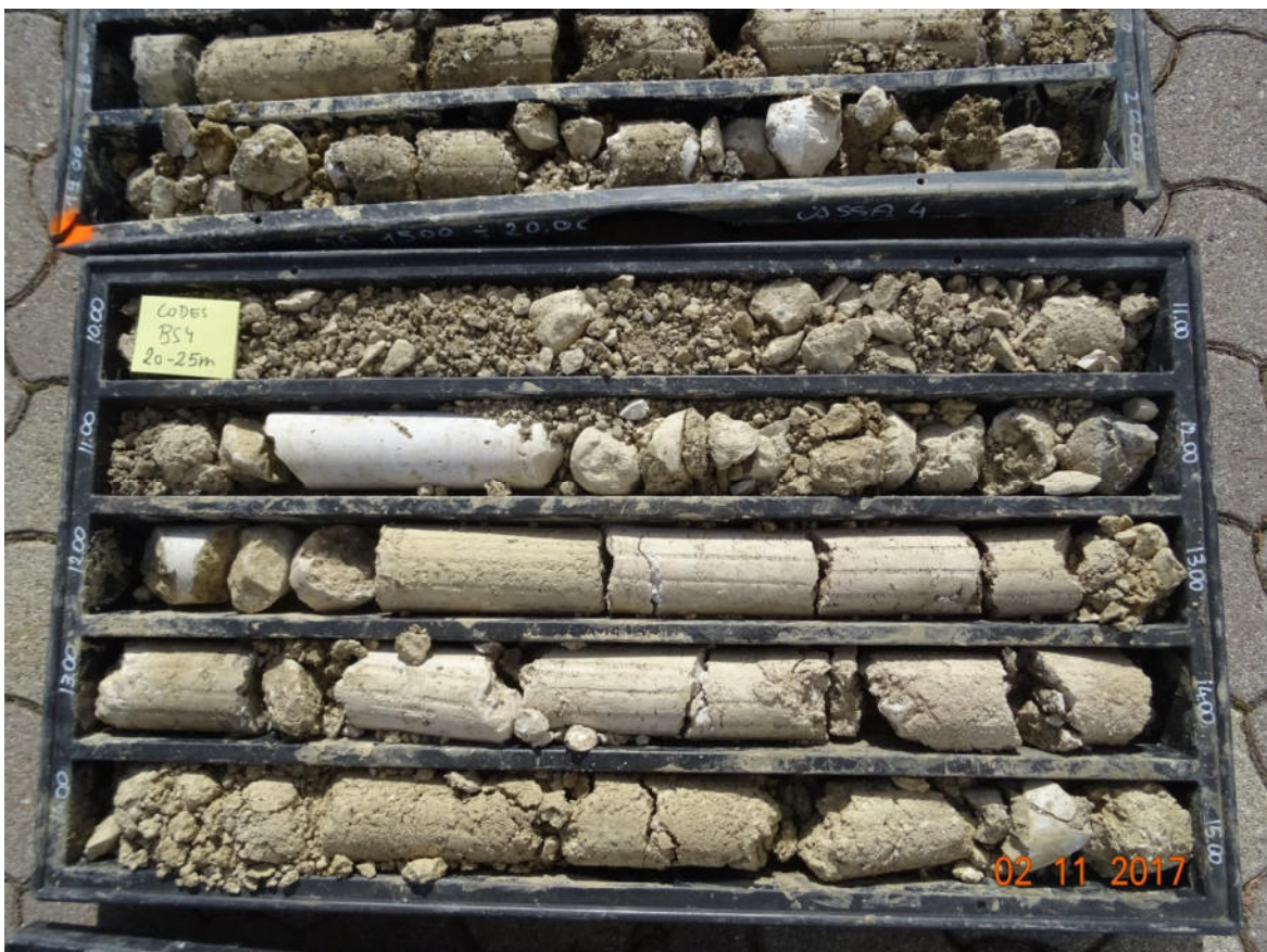
Sondaggio BS4 20-25 m