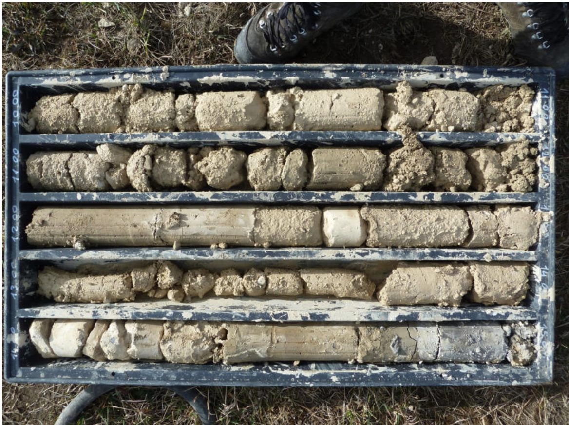
Sondaggio BS4 10-15 m