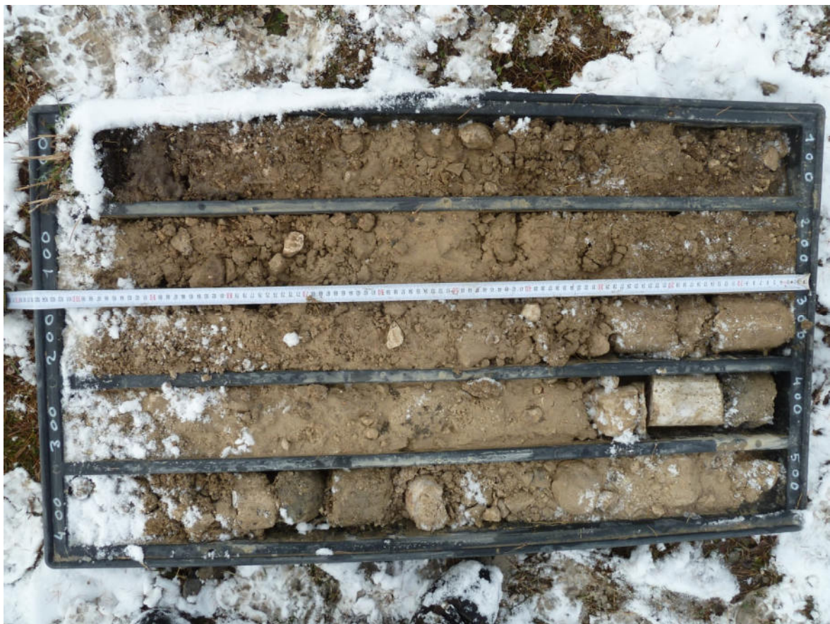
BS3 0-5 m