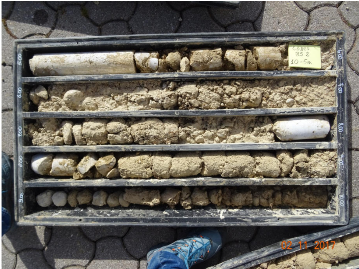
BS2 5-10 m