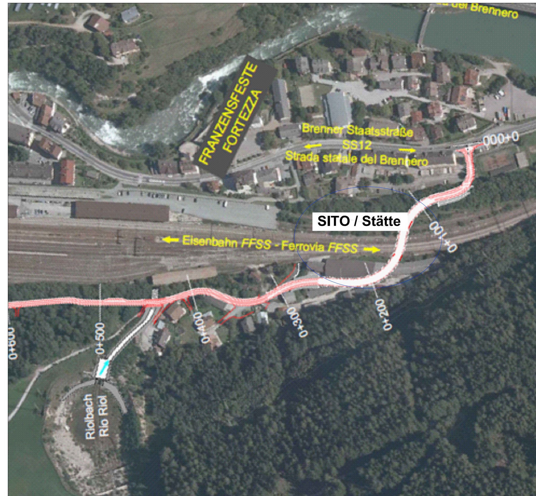
FOTO AEREA LUFTAUFNAHME