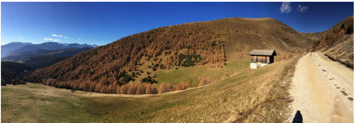
Foto 2: Blick vom Skigebiet Gitschberg auf das Gebiet „Klein-Gitsch“