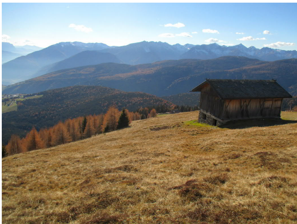
Foto 9: geplante Piste „Klein-Gitsch“ - mittlerer Bereich oberhalb der „Moseralm“