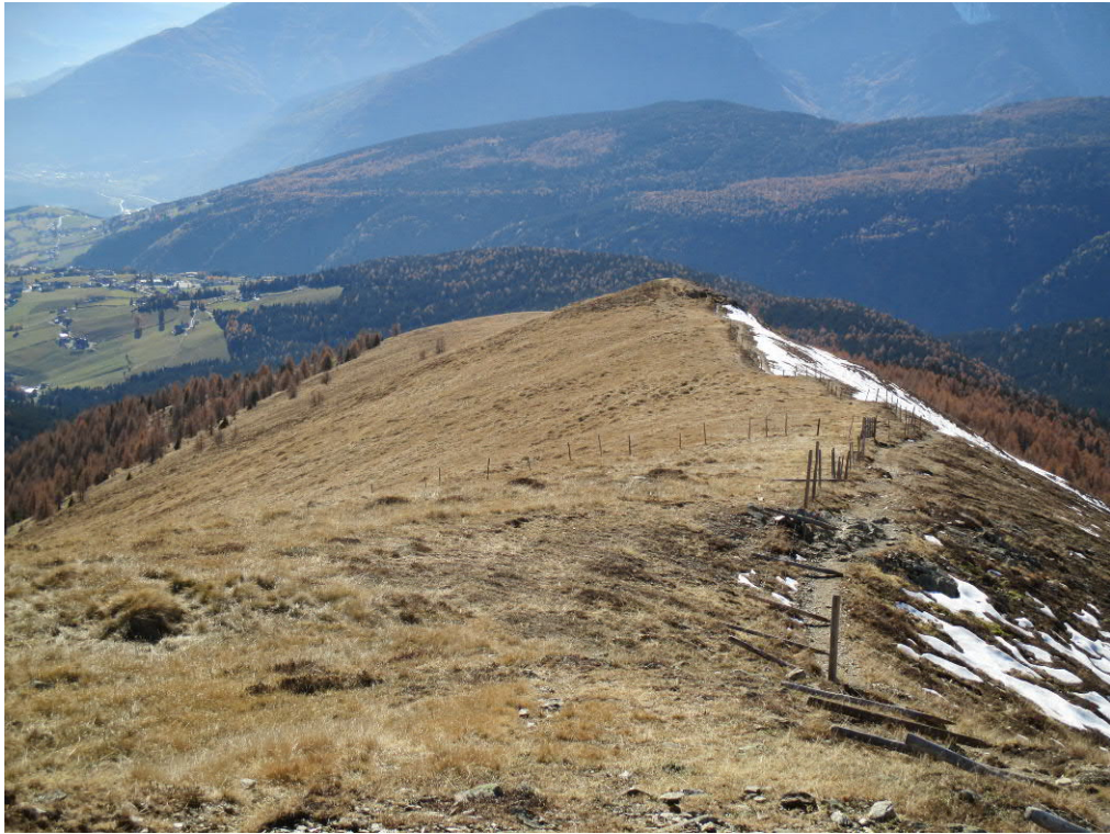
Foto 5: Blick von geplanter Bergstation in Richtung geplanter Piste „Klein-Gitsch“