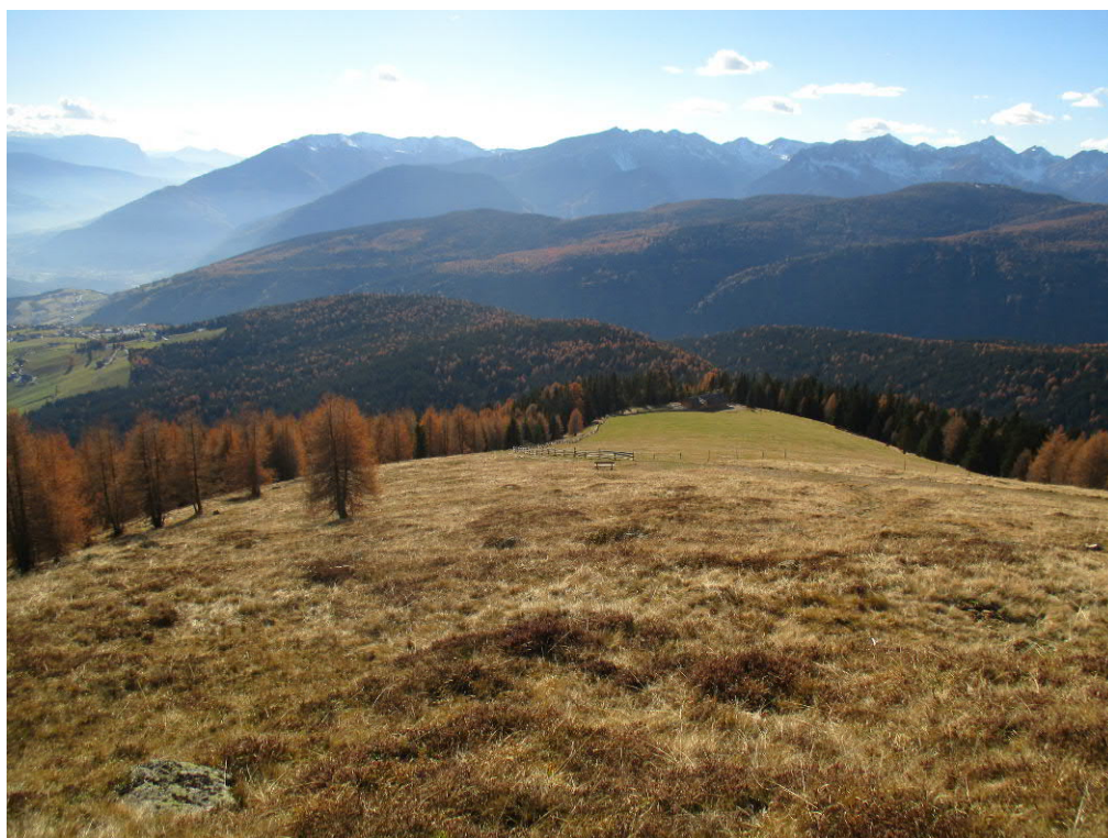
Foto 10: geplante Piste „Klein-Gitsch“ - mittlerer Bereich oberhalb der „Moseralm“