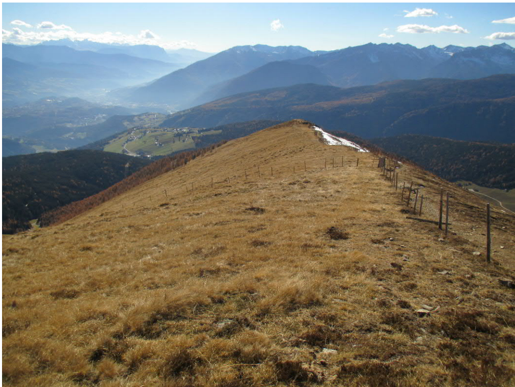
Foto 6: geplante Piste „Klein-Gitsch“ - oberer Bereich entlang Geländekamm