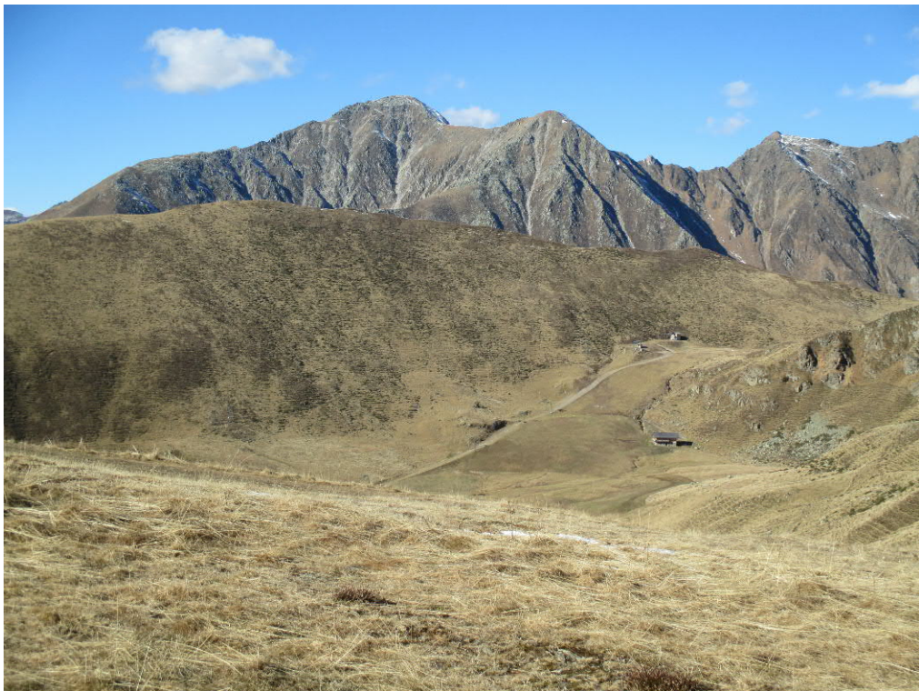
Foto 20: Blick vom Skigebiet Gitschberg in Richtung geplanter Piste „Mitterberg II“