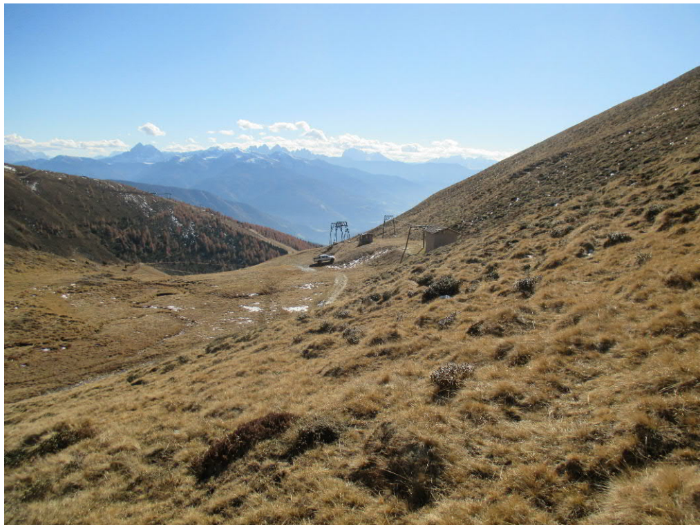
Foto 24: Geplante Piste „Mitterberg II“ - unterster Bereich - Anbindung an bestehende Anlagen