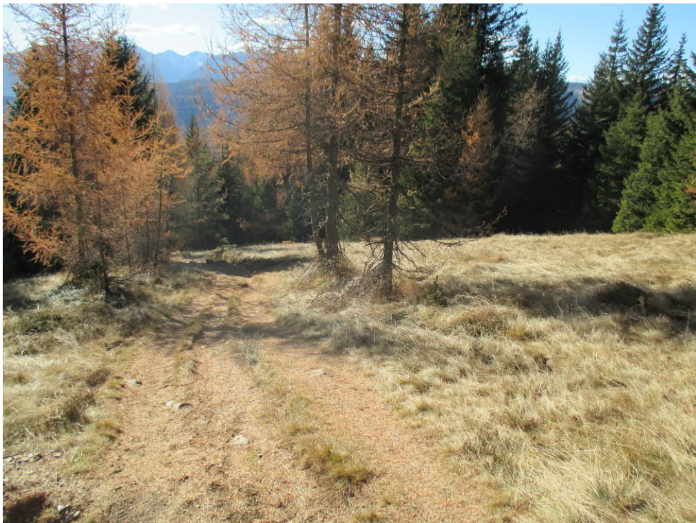
Foto 12: geplante Piste „Klein-Gitsch“ - unterer Bereich nach „Moseralm“