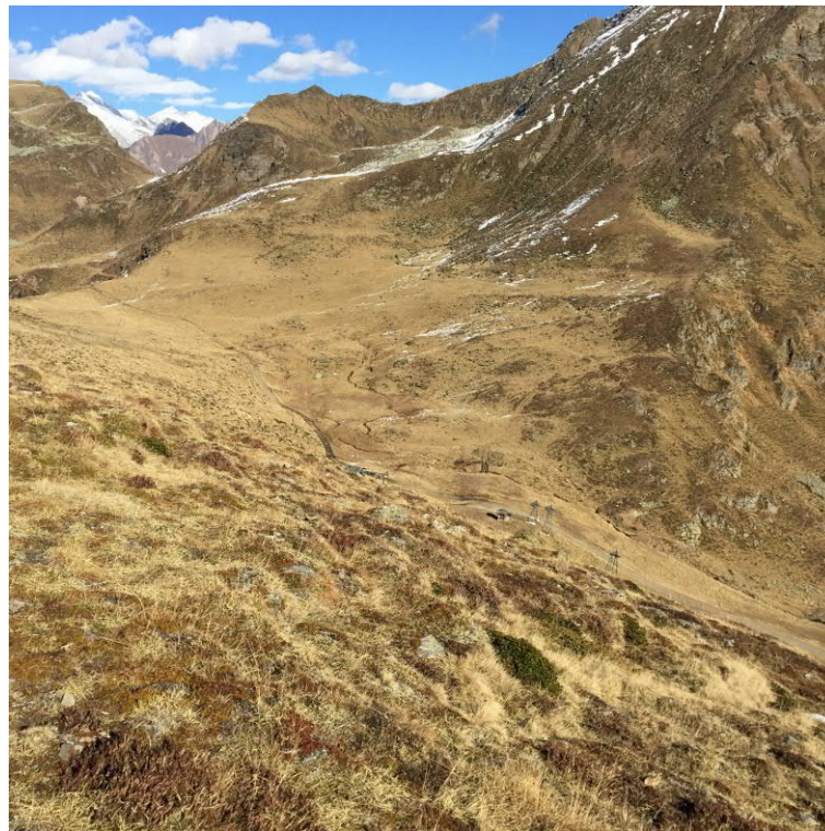
Foto 21: Blick von geplanter Bergstation in Richtung geplanter Piste „Mitterberg II“