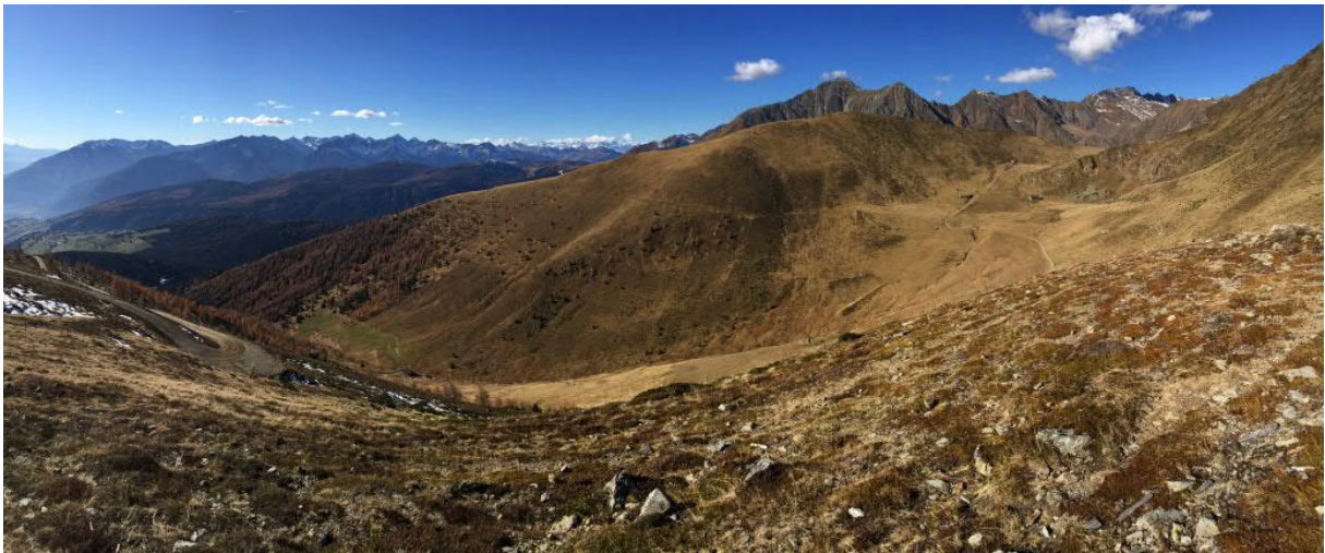
Foto 1: Blick vom Skigebiet Gitschberg auf das Gebiet „Klein-Gitsch“