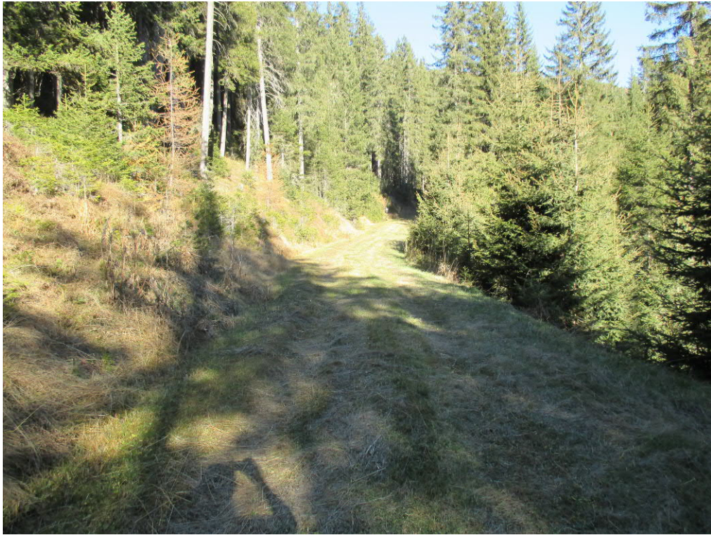
Foto 19: geplante Piste „Klein-Gitsch“ - geplante Einmündung in bestehende Talabfahrt