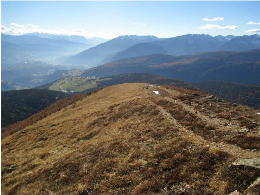
Foto 7: geplante Piste „Klein-Gitsch“ - oberer Bereich entlang Geländekamm