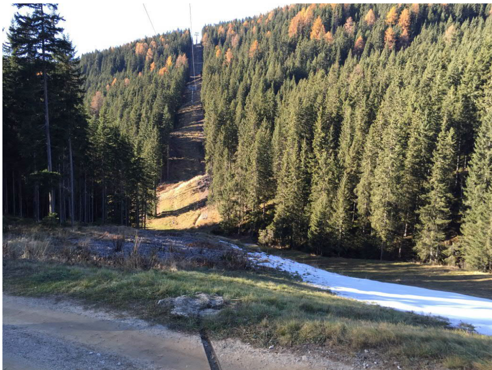
Foto 18: geplante Piste „Klein-Gitsch“ - unterster Abschnitt mit Anbindung an neue Umlaufbahn