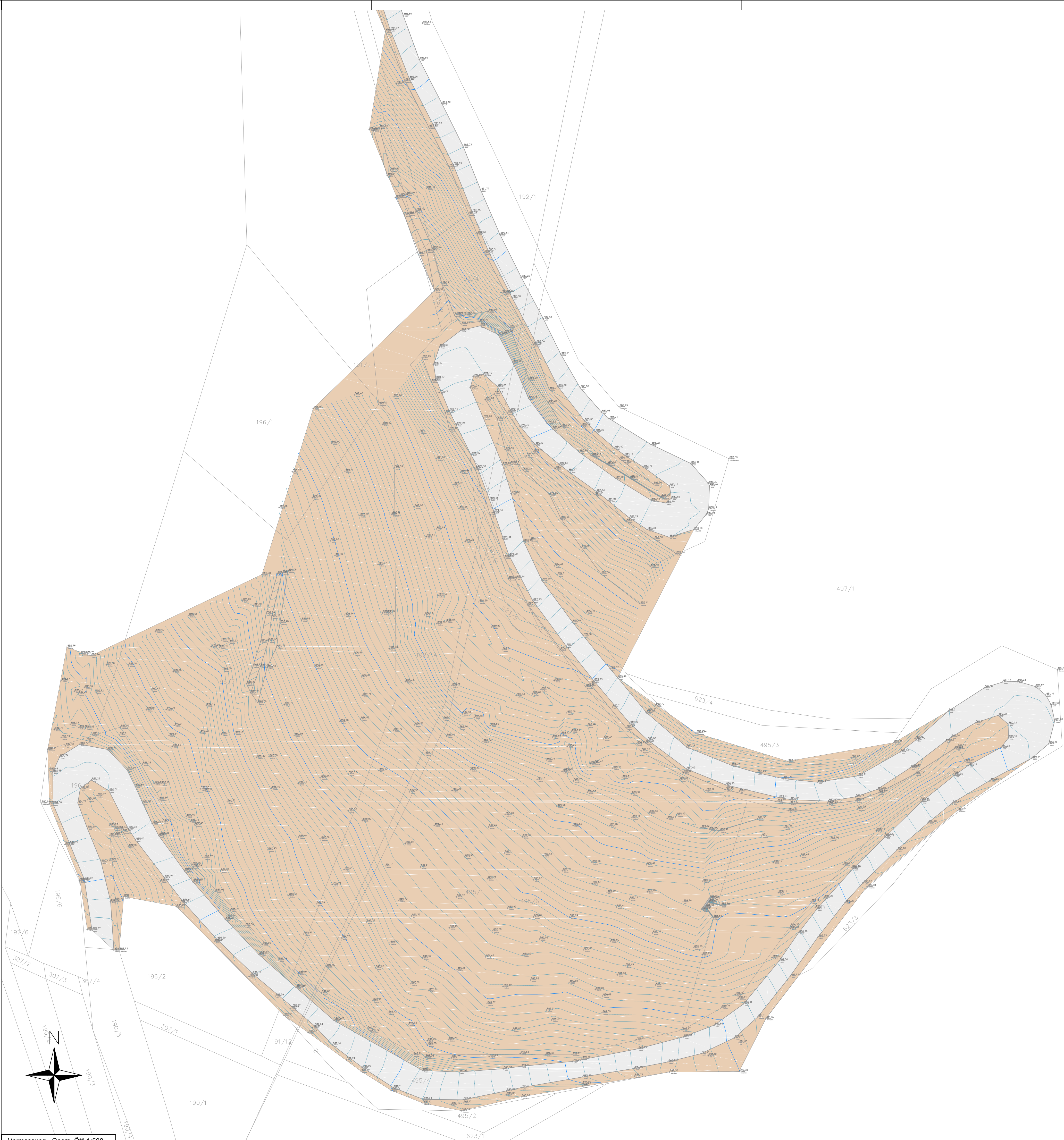
Vermessung - Geom. Örtl 1:500