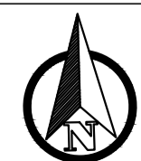
Katastrerauszug - estratto mappa 1:1000