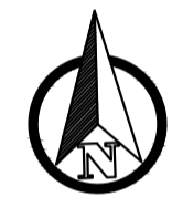
Grundkarte - carta tecnica 1:2000