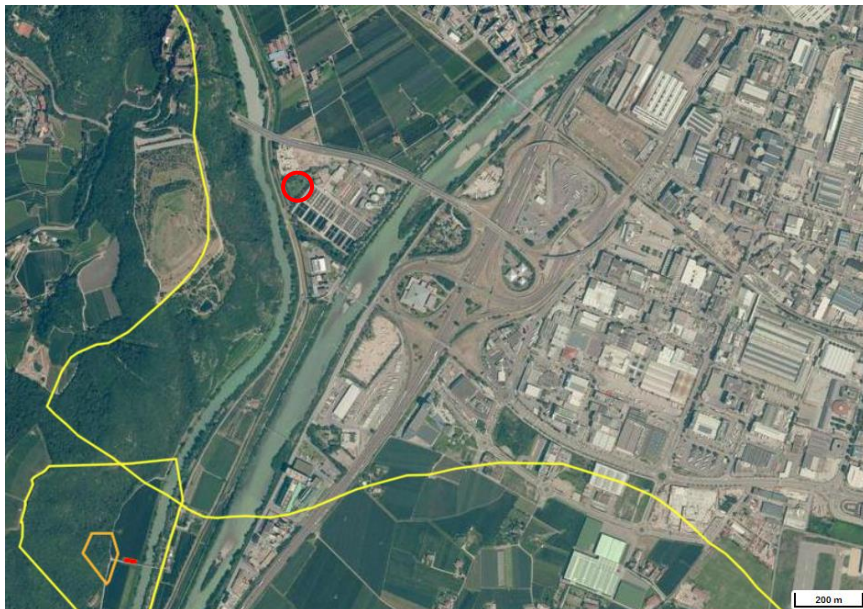
Fig. 3: Ortofoto con delimitazione in giallo della zona di tutela III della falda potabile della conca di Bolzano

Il sito in esame è vincolato dalla zona di rispetto III per acque potabili della conca di Bolzano. Il piano di tutela WSG/1/0, approvato con la Delibera della Giunta Provinciale nr. 5922 del 17.10.1983, che ne prescrive i vincoli, in questa zona di tutela consente scavi fino a 1 metro sopra al livello massimo della falda acquifera.