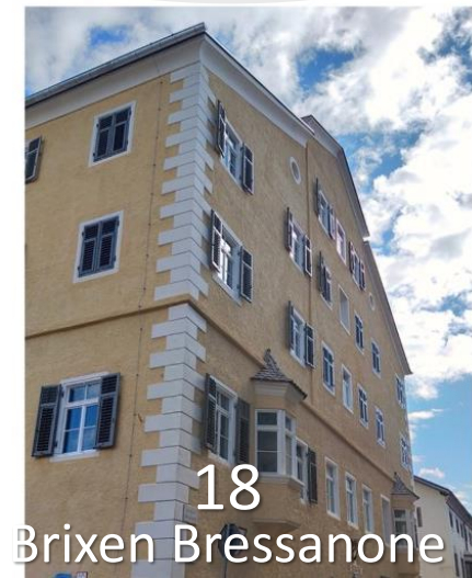
18 Brixen Bressanone