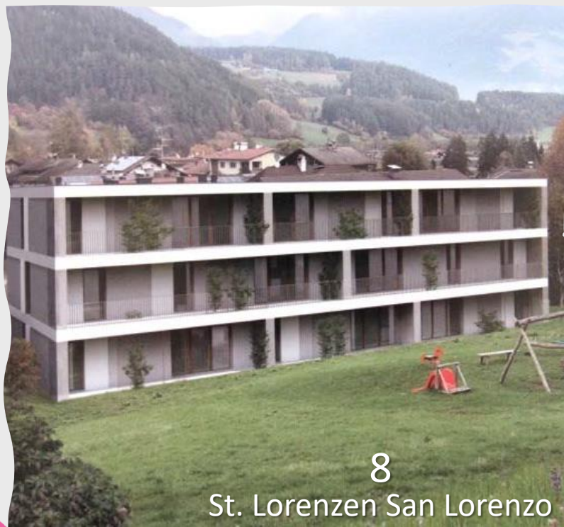
8 St. Lorenzen San Lorenzo