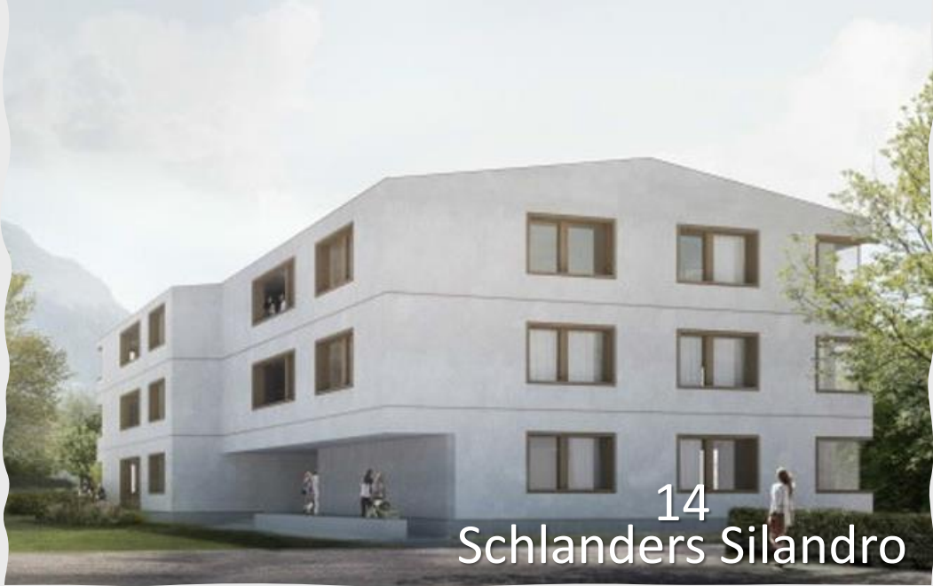
14 Schlanders Silandro