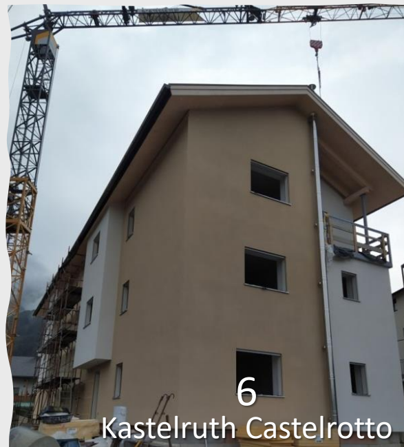
6 Kastelruth Castelrotto