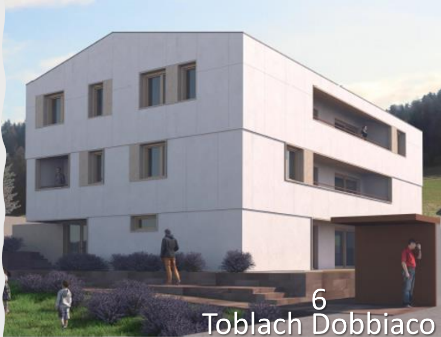
6 Toblach Dobbiaco