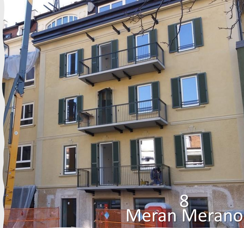
8 Meran Merano