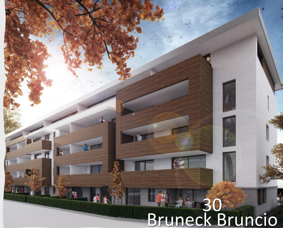
30 Bruneck Bruncio