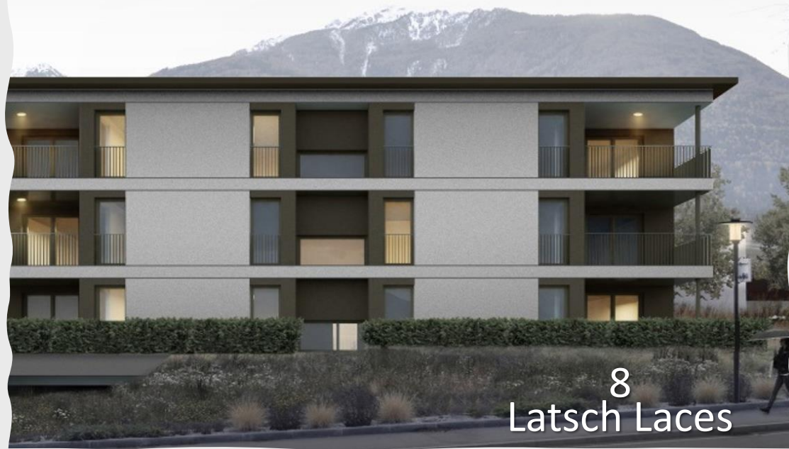
8 Latsch Laces