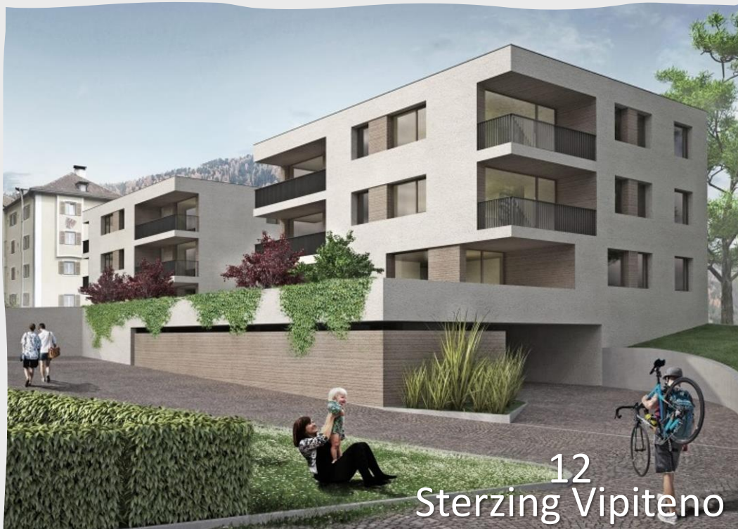
12 Sterzing Vipiteno