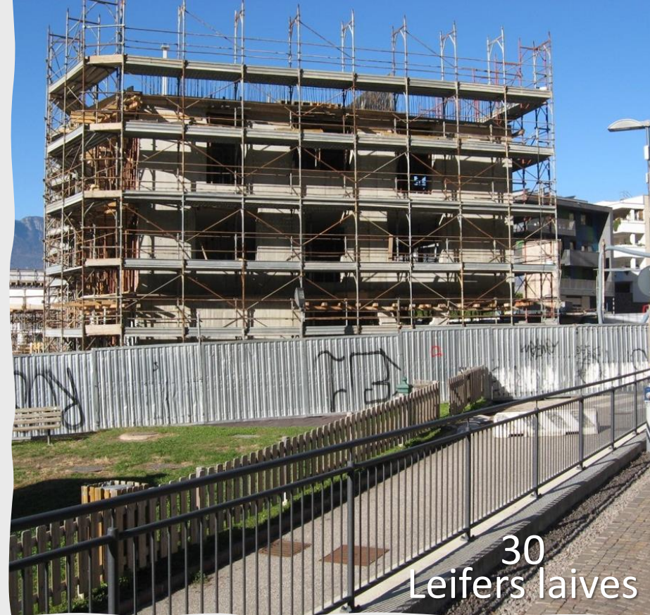
30 Leifers laives