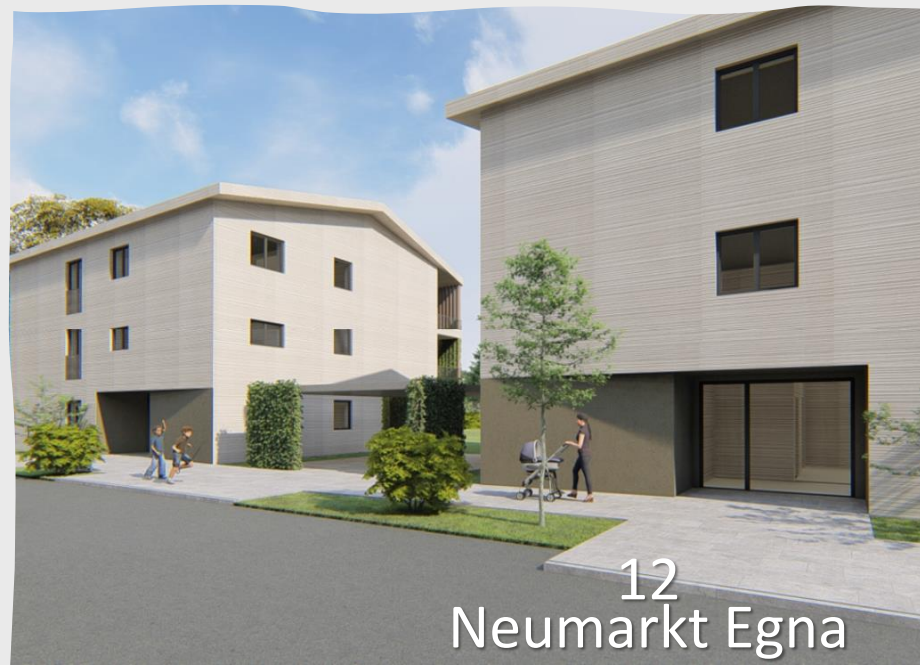
12 Neumarkt Egna