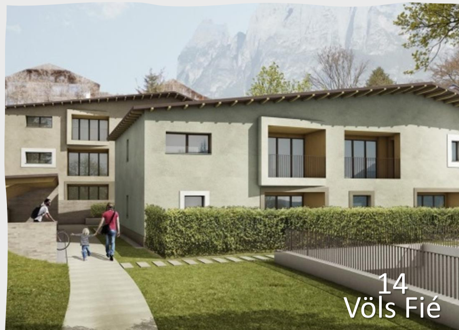
14 Völs Fié