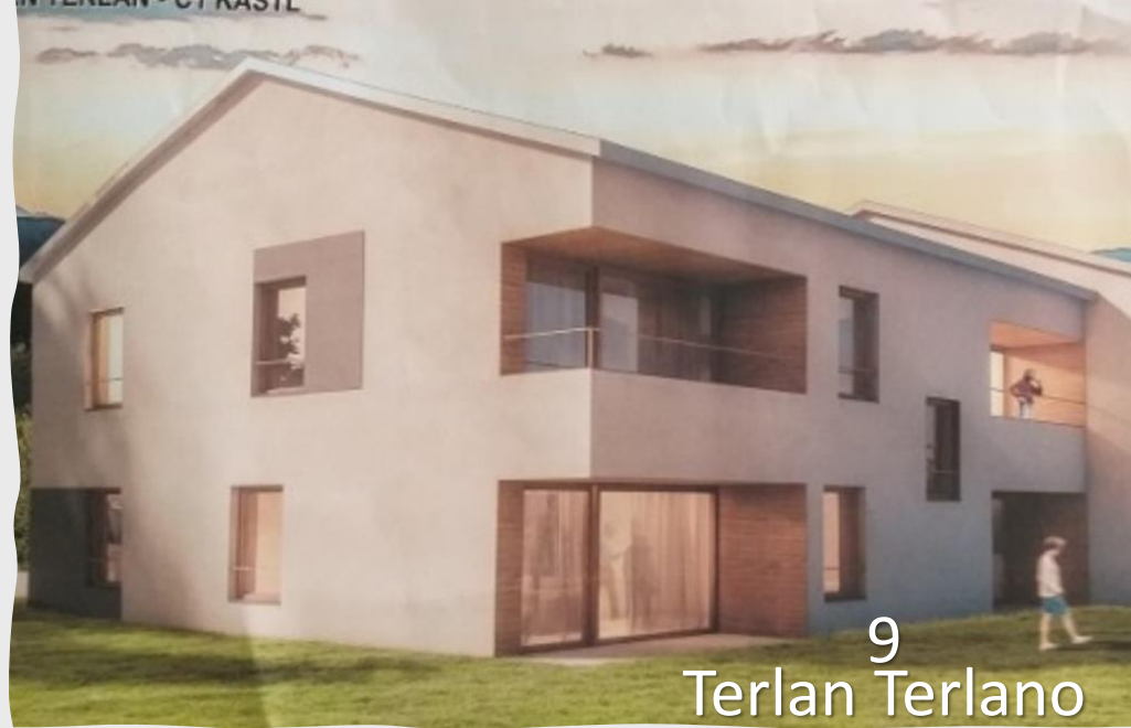
9 Terlan Terlano