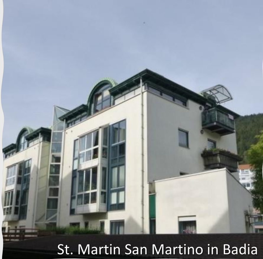
St. Martin San Martino in Badia