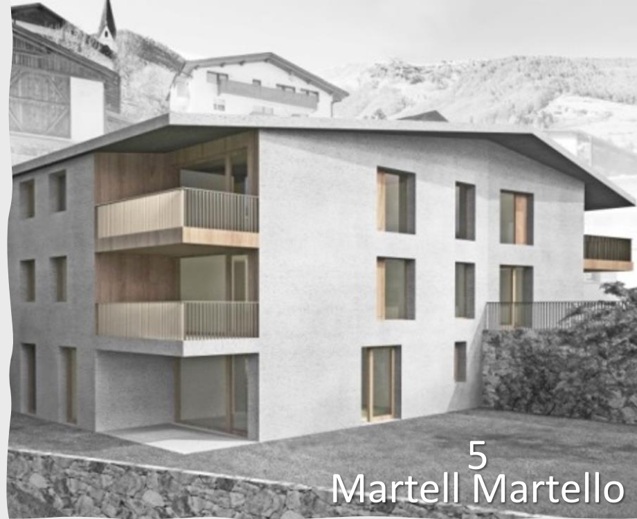
5 Martell Martello