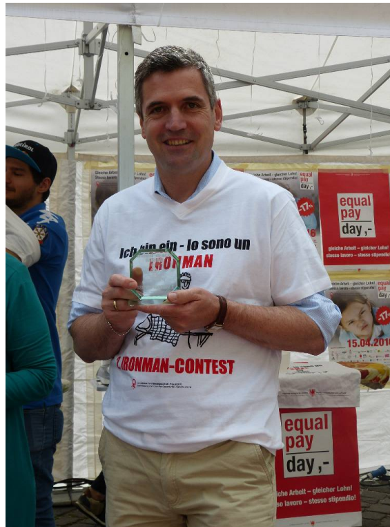
EU-Parlamentarier Herbert Dorfmann