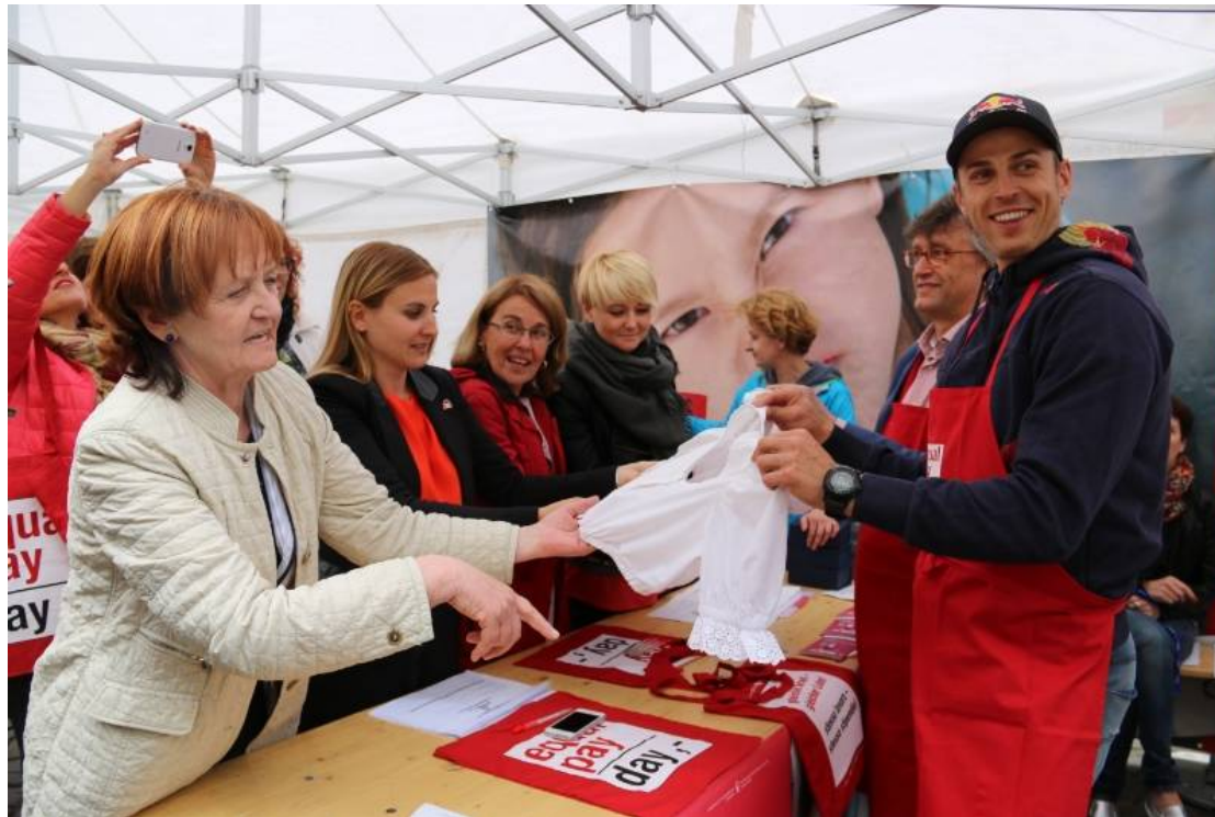
Snowboarder Roland Fischnaller