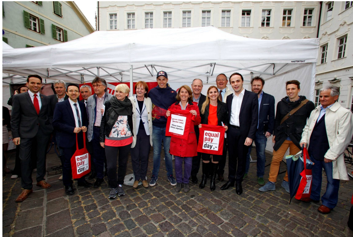
Snowboarder Roland Fischnaller