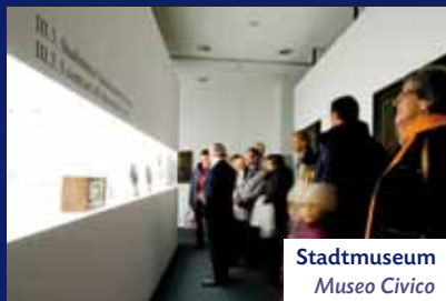
Stadtmuseum Museo Civico