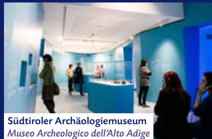
Südtiroler Archäologiemuseum Museo Archeologico dell'Alto Adige