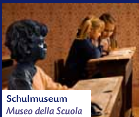
Schulmuseum Museo della Scuola