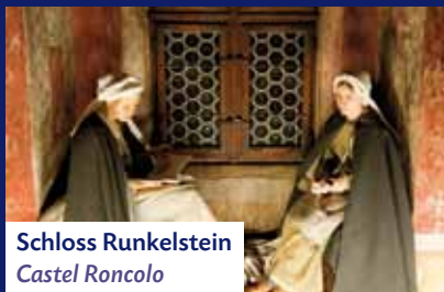
Schloss Runkelstein Castel Roncolo