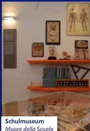
Schulmuseum Museo della Scuola