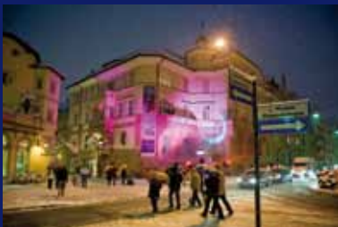
Südtiroler Archäologiemuseum Museo Archeologico dell'Alto Adige