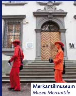
Merkantilmuseum Museo Mercantile