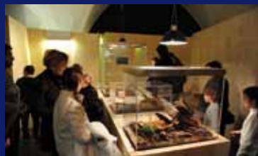
Naturmuseum Südtirol Museo di Scienze Naturali dell'Alto Adige