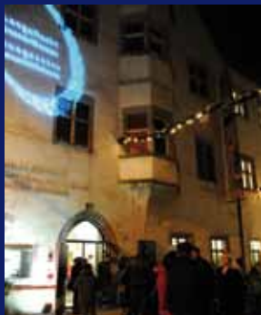
Naturmuseum Südtirol Museo di Scienze Naturali dell'Alto Adige