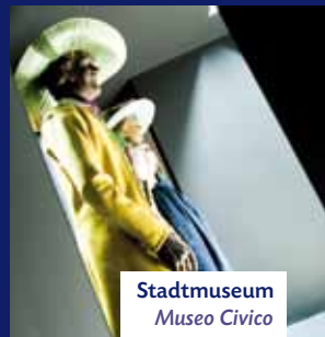
Stadtmuseum Museo Civico