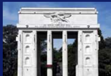
Dokumentations-Ausstellung im Siegesdenkmal Percorso espositivo nel Monumento alla Vittoria