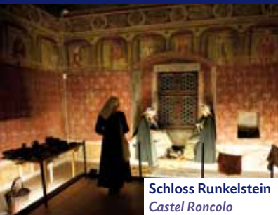
Schloss Runkelstein Castel Roncolo