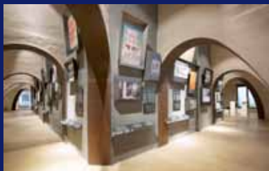
Dokumentations-Ausstellung im Siegesdenkmal Percorso espositivo nel Monumento alla Vittoria