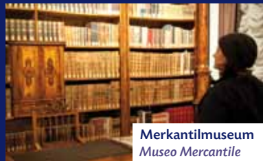
Merkantilmuseum Museo Mercantile