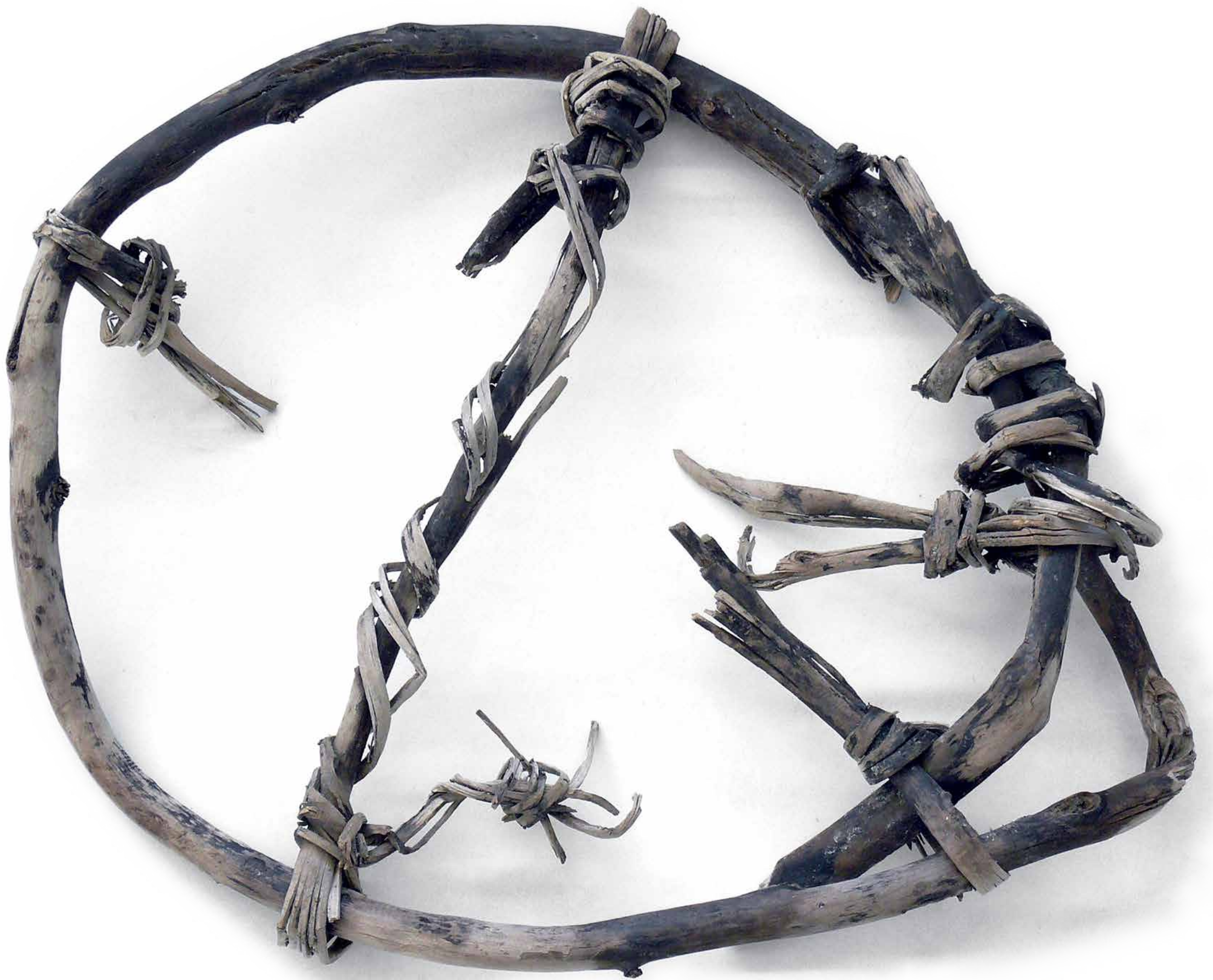
Neolithischer Schneeschuh vom Gurgler Eisjoch, 3800 – 3700 v. Chr.