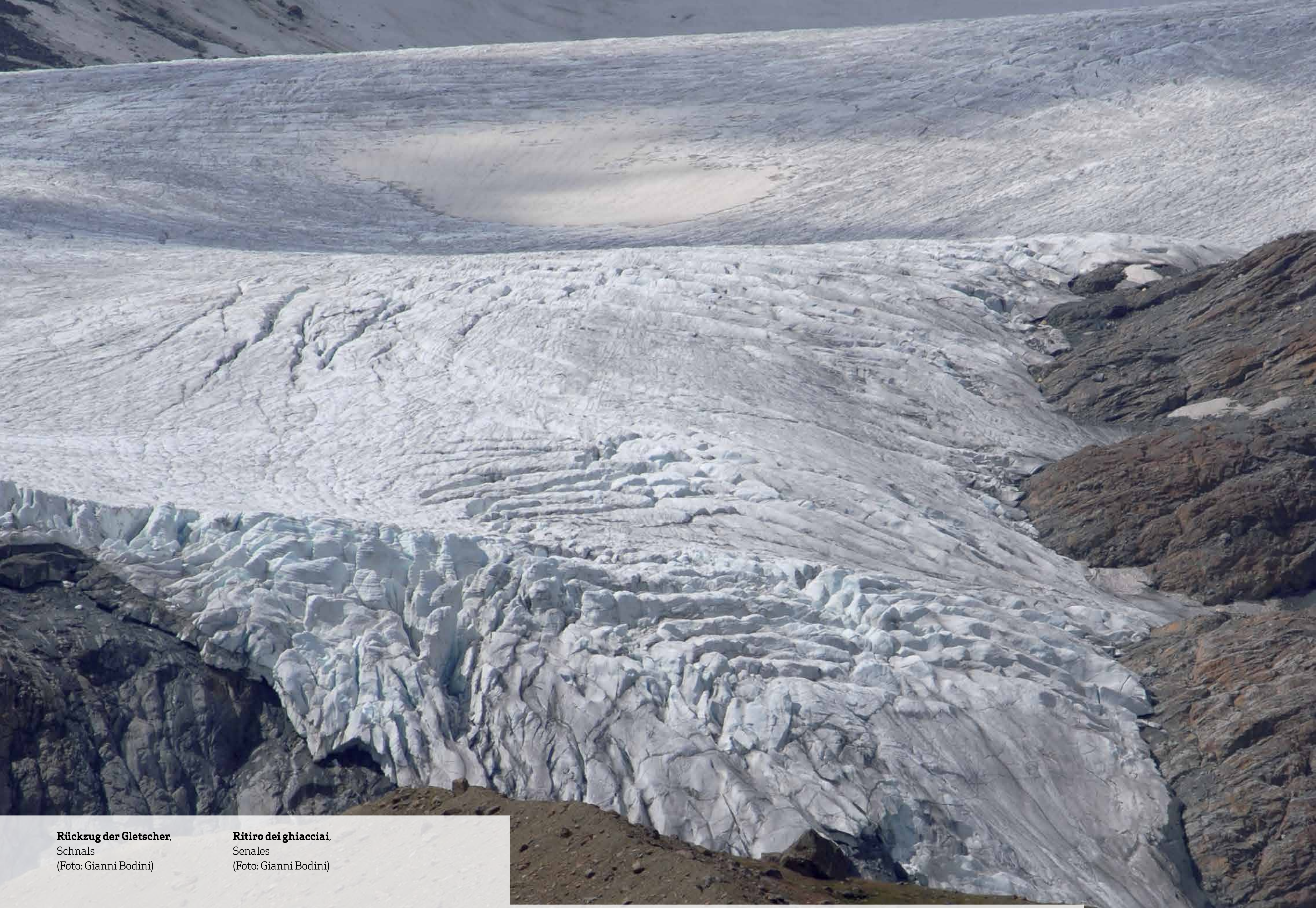
Rückzug der Gletscher. Schnals