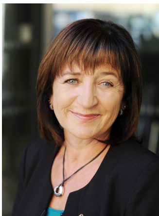
Landesarätin | Assessora Beate Palfrader

La Giornata dei musei dell'Euregio 2016 vede invece gli stessi collaboratori e collaboratrici dei musei del Tirolo, dell'Alto Adige e del Trentino in veste di esperti e relatori, nell'ottica di creare una rete culturale tra i tre territori dell'Euregio. Rifacendosi alla formula internazionalmente consolidata del "world café" l'evento consente di mettere in luce tramite uno scambio diretto le specifiche competenze esistenti e le esigenze concrete degli operatori museali all'interno dell'Euregio, sviluppando modalità per intensificare in futuro gli scambi e il sostegno reciproco tra i musei. Un convegno assolve validamente la sua funzione se consente ai partecipanti di conoscersi meglio tra loro offrendo sufficiente spazio alla costruzione di reti. La Giornata dei musei dell'Euregio 2016 è orientata a perseguire tale obiettivo nell'intento di fornire agli operatori museali dei tre territori riferimenti e reti specifiche all'interno dell'Euregio. Ci rallegriamo della Vostra partecipazione e Vi auguriamo una fruttuosa collaborazione nell'ambito di nuove reti.