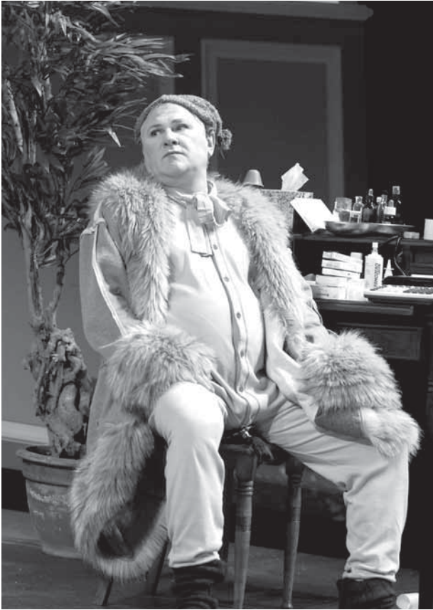
Der eingebildete Kranke